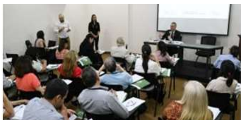
Sesión Ordinaria de la CNCC

La Asociación de ONGs del Paraguay – POJOAJU pasó a integrar la Comisión Nacional del Cambio Climático como miembro pleno en el mes de febrero, en la primera sesión ordinaria del año de la Comisión Nacional de Cambio Climático (CNCC) convocada por el Ministerio del Ambiente y Desarrollo Sostenible (MADES), a través de la Dirección Nacional de Cambio Climático (DNCC).